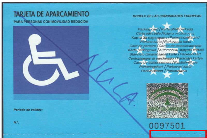
Detalle de la zona de corte.